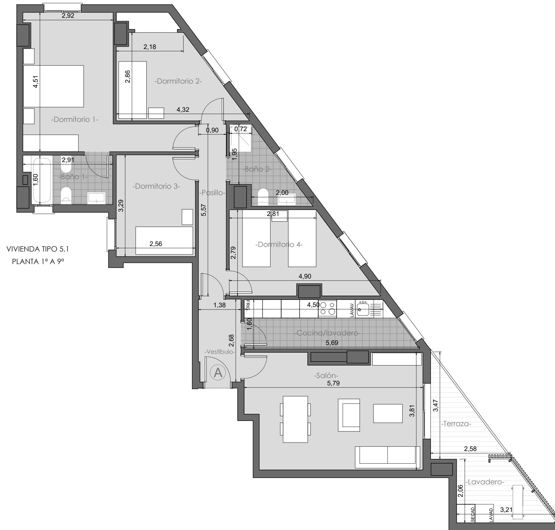
VIVIENDA TIPO 5.1 PLANTA 1ª A 9ª